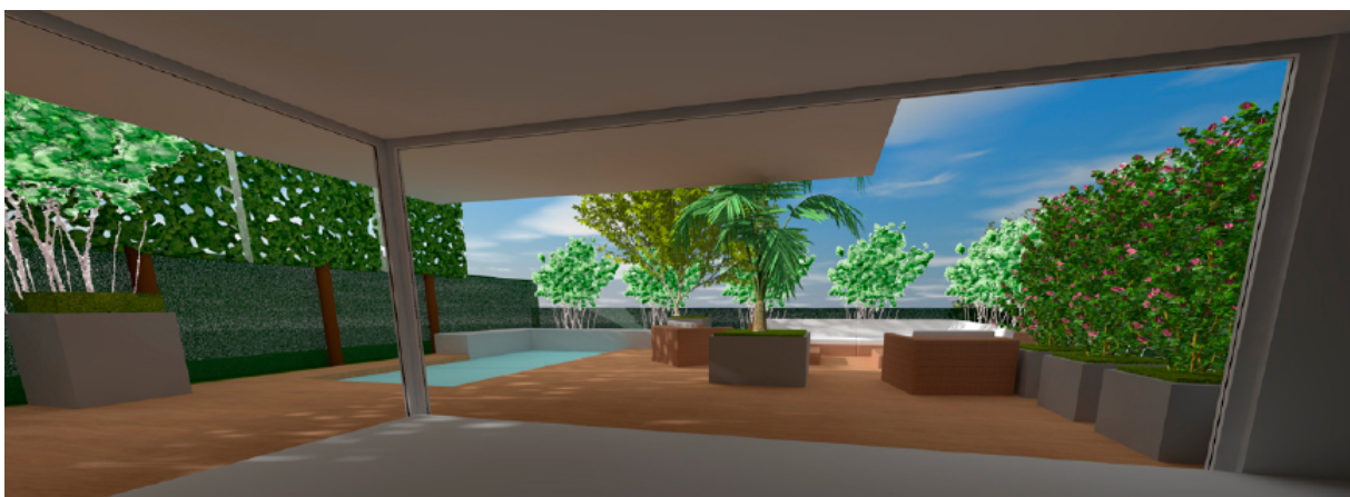
Visualisierung eines Gartendesigns

Lässt der Kunde den Garten dann auch bei Otto Arnold bauen, werden 50% der Planungskosten mit den Baukosten verrechnet. Das schafft einen zusätzlichen Anreiz und funktioniert: 80 - 90% der Gärten werden vorher professionell geplant.