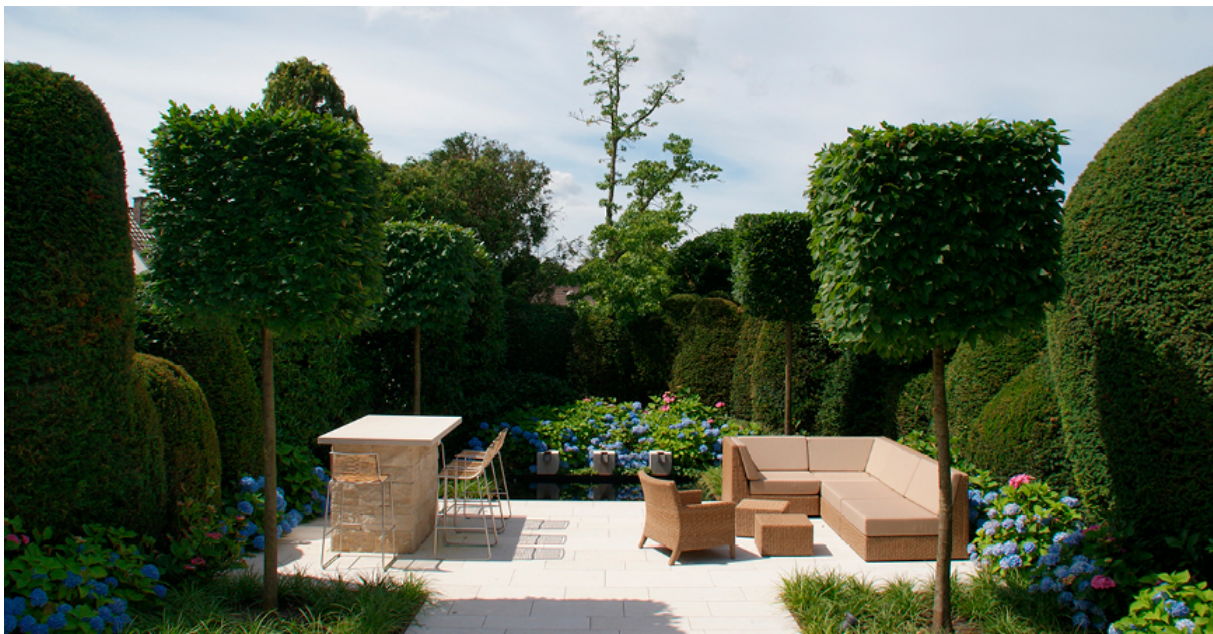
Garten des Jahres 2017: Sonderpreis Moderner Hausgarten

Die Otto Arnold GmbH mit Sitz in Leinfelden-Echterdingen bietet ihren Kunden seit rund 60 Jahren das komplette Spektrum aus Gartenbau, Gartenpflege und Landschaftsarchitektur aus einer Hand. Das traditionsreiche Familienunternehmen erhielt dafür schon viele hochkarätige Preise. 2017 wurde ein Projekt als einer der schönsten Privatgärten des Jahres im deutschsprachigen Raum ausgewählt und mit dem Sonderpreis „Moderner Hausgarten“ ausgezeichnet.